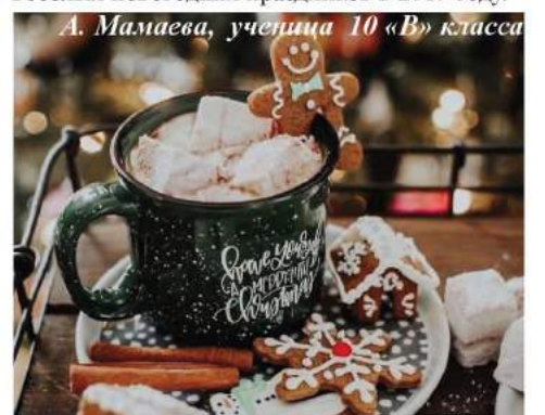
А. Мамаева, ученица 10 «В» класса

Завершение хочется каждому пожелать удачных проектов для украшения дома и веселых новогодних праздников в 2019 году.